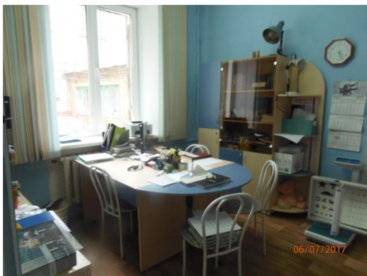
Φοτο Νο 4