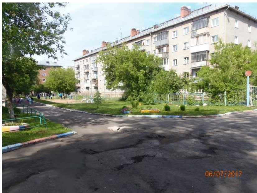
Φοτο Νο 1