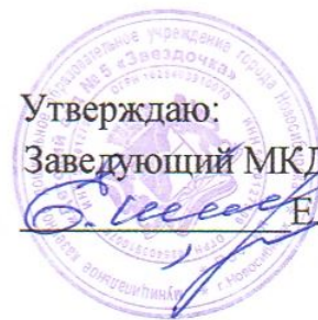
График получения пищи 01.09.2023-31.08.2024